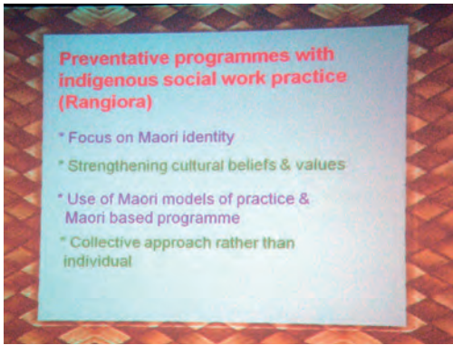
Maorilaisen sosiaalityön painotuksia.