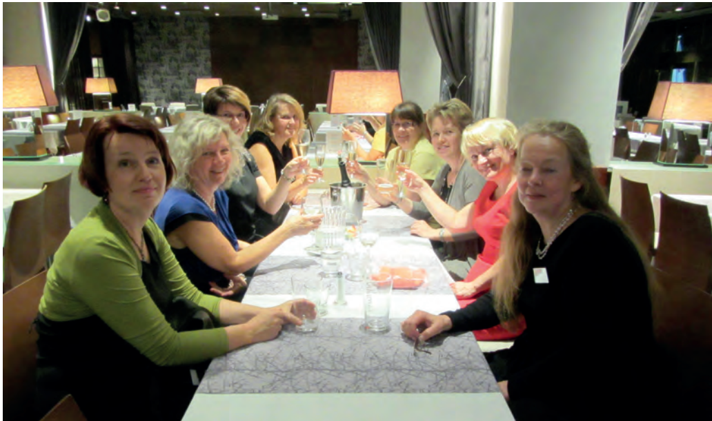
Jyväskylän koulukuraattoreita.