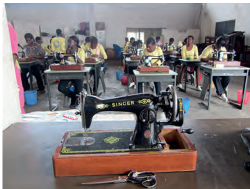
Tyttöjä kouluttautumassa ompelijoiksi. Kuva Curator 1/2012.