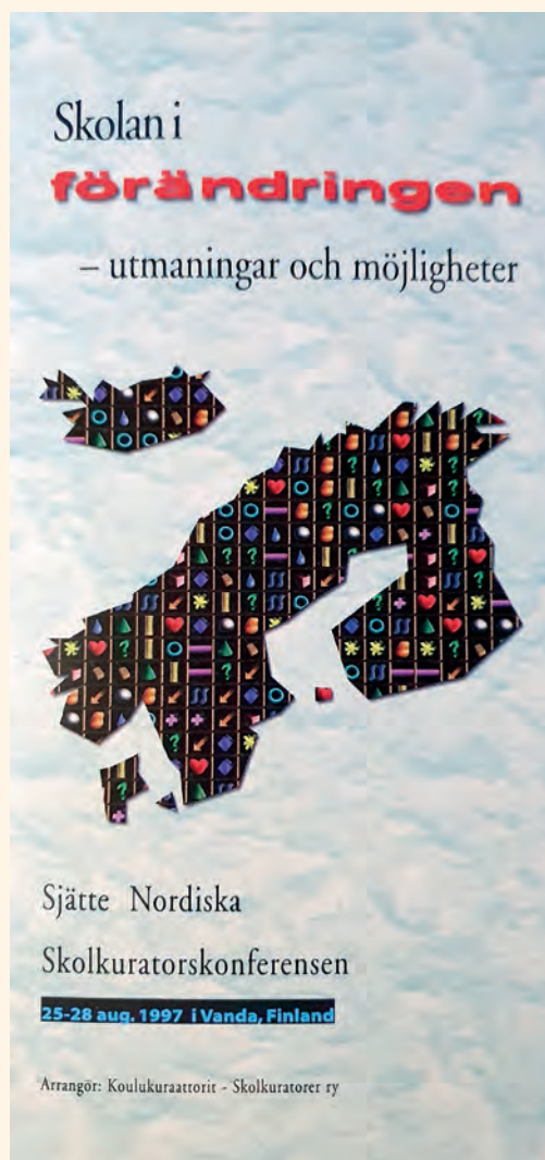
Skolan i förändringen – utmaningar och möjligheter 1997-seminariebroschyr.

Diskussioner fördes om en nordisk konferens kunde ordnas på Island men eftersom det endast fanns en heltids och två halvtids kuratorer där skulle uppgiften ha blivit alltför tung för dem. I finska Skolkuratorsföreningens styrelse fanns just då flera medlemmar från Vanda