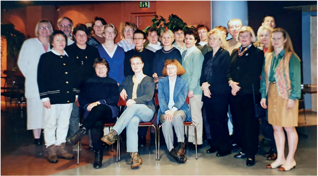
Koulun sosiaalityön asiantuntijakoulutuksen toisen kurssin osallistujat vuonna 2000.

koulutusryhmän sisäistä verkostoitumista ja mukavia muistoja iltaohjelmiseen, harjoitukseen ja sisäpiirijuttuineen.