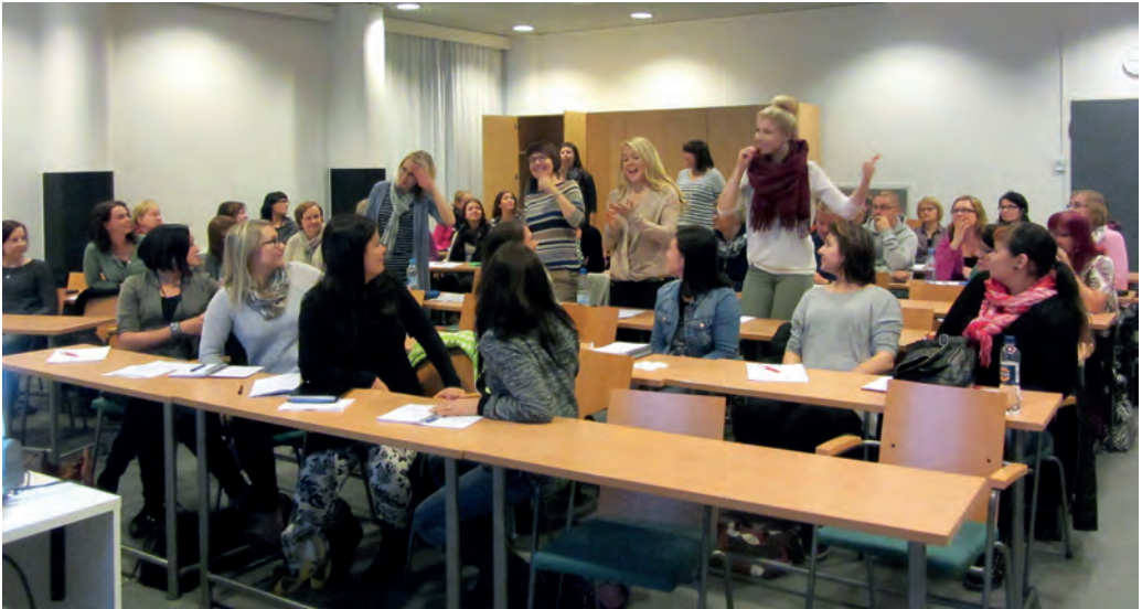
Kuopiossa Savon ja Pohjois-Karjalan kuraattoreita esittämässä sanattomasti miten päivä on lähtenyt käyntiin. Kuva Curator 2015.

mukainen palvelutarpeen selvitys ei kuulunut kuraattorin tehtäviin, mutta pyyntöjä tuohon tehtävään oli alkanut kuraattoreille tulla. Oppilas- ja opiskelijahuoltolaki ei kuitenkaan määritellyt tuota tehtävää kuraattorin tehtäväksi.