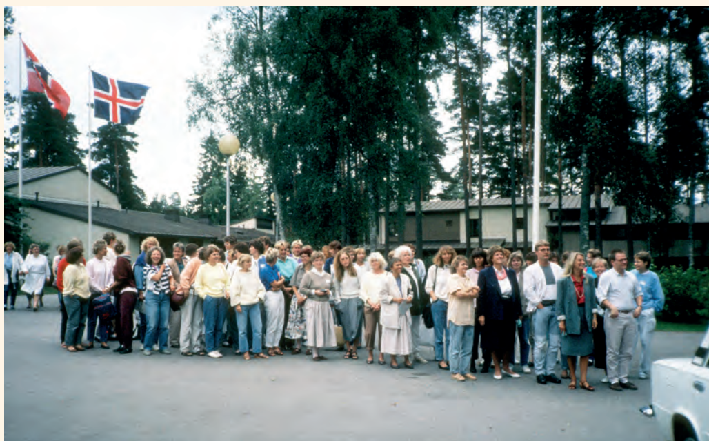
Deltagare i konferensen.