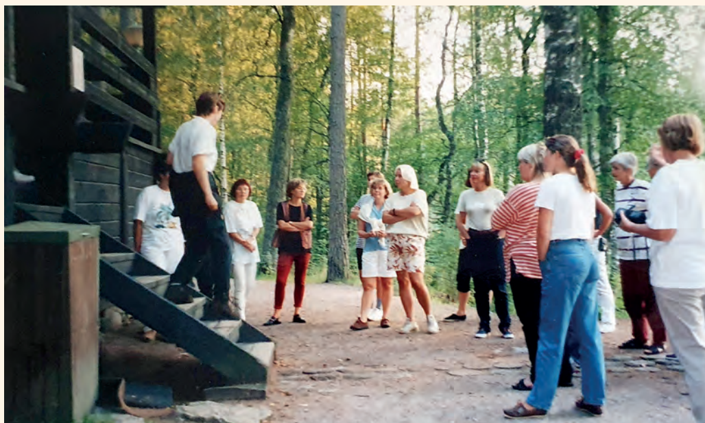
Bastu vid Nouks.

så den sjätte konferensen ordnades där. I konferensen deltog 74 kuratorer från Danmark, Estland, Finland, Norge och Sverige.