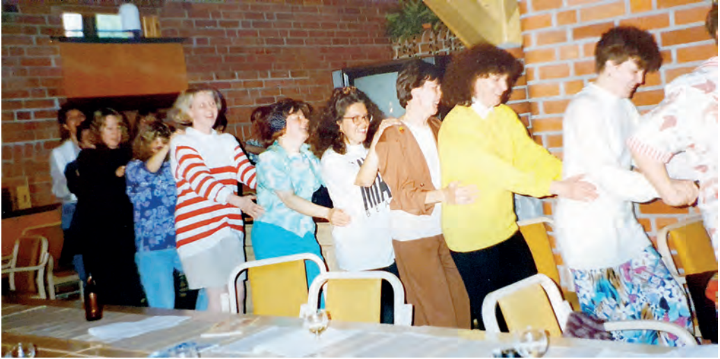
Hauskaa illanviettoa Heinolan kurssikeskuksen viimeisillä Koulukuraattorien täydennyskoulutuspäivillä toukokuussa 1992.

arvioivat yhteistyössä lapsen ongelmien parissa työskentelevät henkilöt. Kansanedustajat olivat kiinnostuneet asiasta ja suhtautuivat myönteisesti yhdistyksen esitykseen. Kuulemisen seurauksena peruskoululain 36 a § 2 mom. (707/1992) hyväksyttiin yhdistyksen esittämässä muodossa siten, että erityisluokkasiirroissa myös sosiaalityöntekijän tekemä sosiaalinen selvitys otettiin huomioon asiantuntijan lausuntona ja tarvittaessa voitiin tehdä useampia näistä tutkimuksista. Yhdistyksen oma aktiivisuus tuotti kerrankin tulosta!