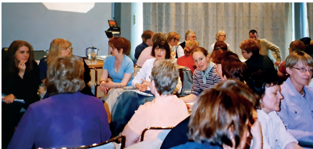
Englantilaisten osallistujien työpaja lasten oikeuksien toteutumisesta päätöksenteossa.