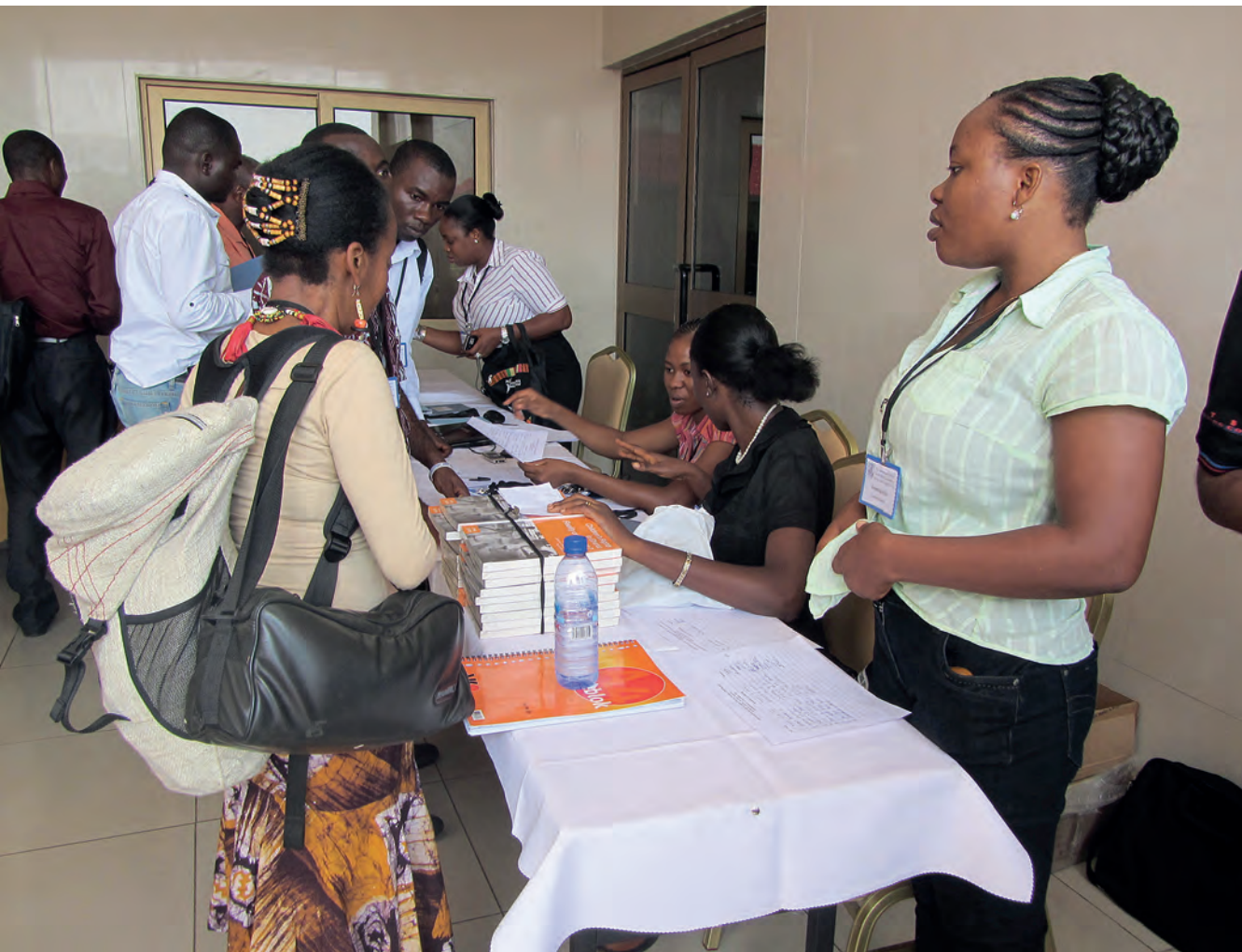
Children's Rights in Ghana: Reality or Rhetoric? -kirjan esittelyä.