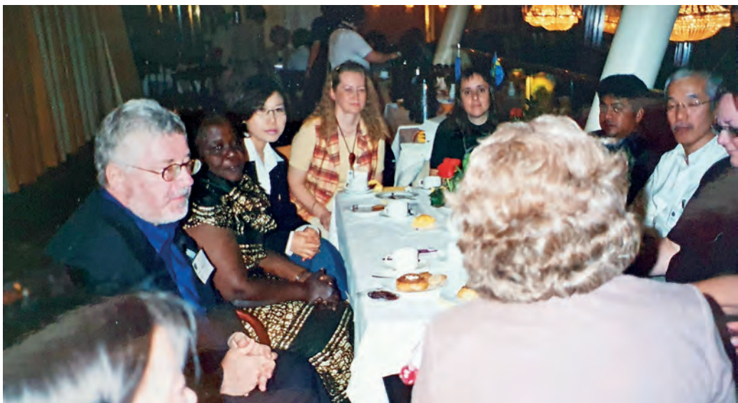
Edustajat Mongoliasta (vas.), Saksasta, Ghanasta, Etelä-Koreasta, Suomesta, Argentiinasta, Sri Lankasta, Japanista, Australiasta ja Ruotsista suunnittelemassa seuraavan konferenssin paikkaa ja ajankohtaa. Keskustelemassa olivat myös USA:n ja Englannin edustajat.