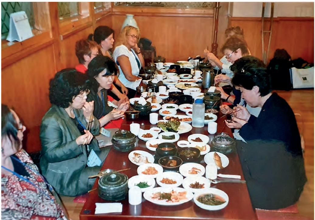
Ruokailua korealaiseen tapaan.