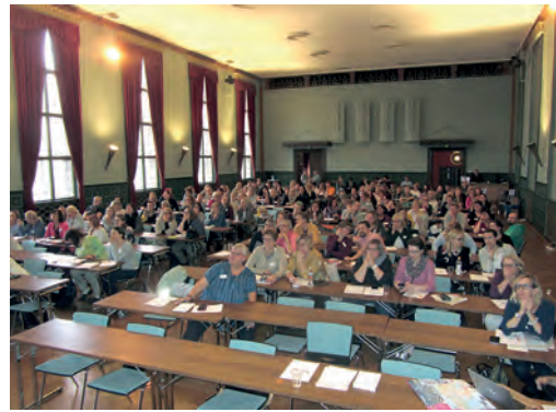
Koulutuksen osallistujia.

henkilöstö on lapsen oppimisen ja hyvinvoinnin turva”. Järjestöt muistuttivat, että lapsille ja nuorille on laissa turvattu oikeus saada opetusta ja kasvatusta sekä opiskeluhuollon ja kouluterveydenhuollon palveluja päteviltä ammattilaisilta. Kouluterveyskyselyn 2017 mukaan etenkin koulupsykologin ja koulukuraattorin vastaanotolle oli vaikea päästä. Järjestöjen mielestä oli ensiksi huolehdittava siitä, että opettajia, psykologeja, kuraattoreita, koulunkäynninavustajia ja terveydenhoitajia on lain edellyttämä riittävä määrä. Lakisääteisten oppilashuoltopalvelujen vajetta ei saanut paikata toisilla ammattiryhmillä, kuten erilaisilla ohjaajilla tai psykiatrian sairaanhoitajilla. Oppilashuollon palveluja tuli tarjota säädösten ja tarpeen mukaisesti. Lapset ja nuoret tuli asettaa etusijalle kuntien budjeteista päätettäessä.