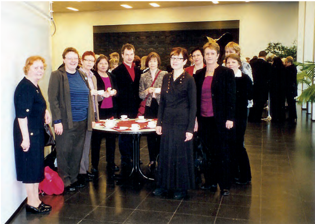
Väitöstilaisuuteen osallistui runsas joukko koulukuraattoreita.