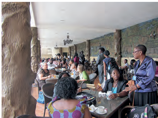
Konferenssin tauolla.